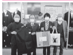
児童養護施設退所者への スーツ贈呈