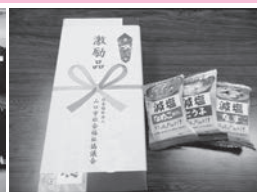
88歳以上のひとり暮らしの 方への激励品贈呈