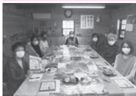
ふれあい・いきいきサロン