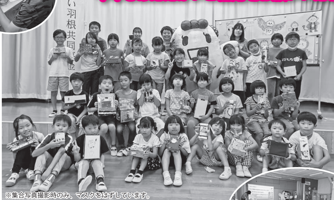
※集合写真撮影時のみ、マスクをはずしています。

10月1日から全国一斉に共同募金運動が始まります。 今年もあたたかいご協力をお願いいたします。